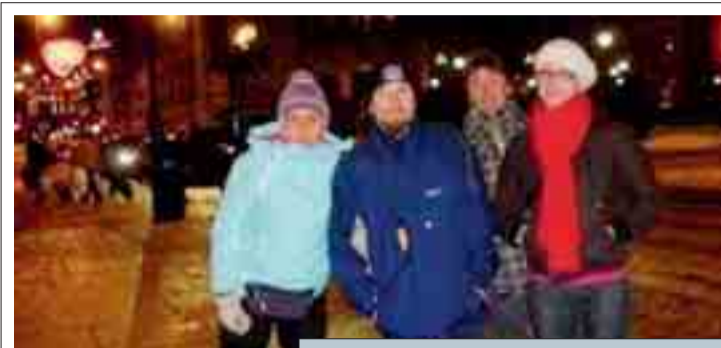
Gli artisti del ghiaccio con un'amica a Oslo

Martedì 15 febbraio: «Arrivati. Il clima non è dei migliori, in realtà siamo solo a -5 ma la vicinanza dell'oceano di Oslofjorden rende il clima umido e particolarmente freddo. (...) Abbiamo incontrato gli organizzatori e fatto il briefing preventivo. La strada dove lavoreremo (Karl Johan) è veramente magnifica, collega il Palazzo Reale a quello del Parlamento: è qui che sorgeranno le sette enormi sculture di